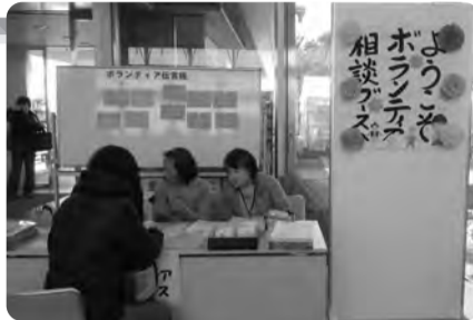
ボランティア相談ブース