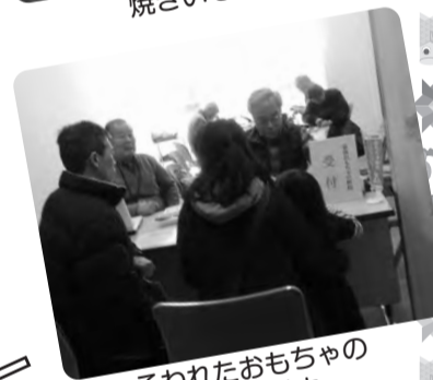
こわれたおもちゃの 修理受付中