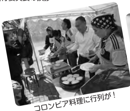
コロンビア料理に行列が!