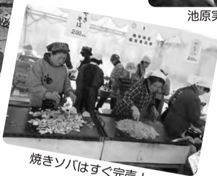
焼きそばはすぐ完売!