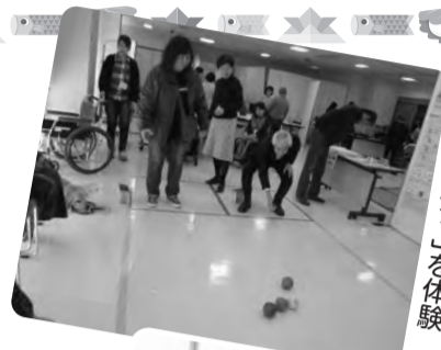
「パラリンピック種目 ボッチャ」を体験