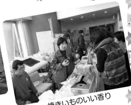
焼きもののいい香り