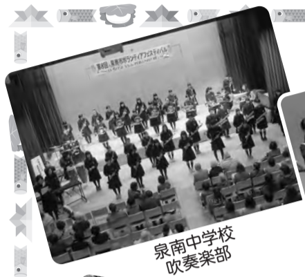
泉南中学校 吹奏楽部