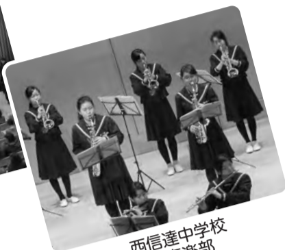
西信達中学校 吹奏楽部