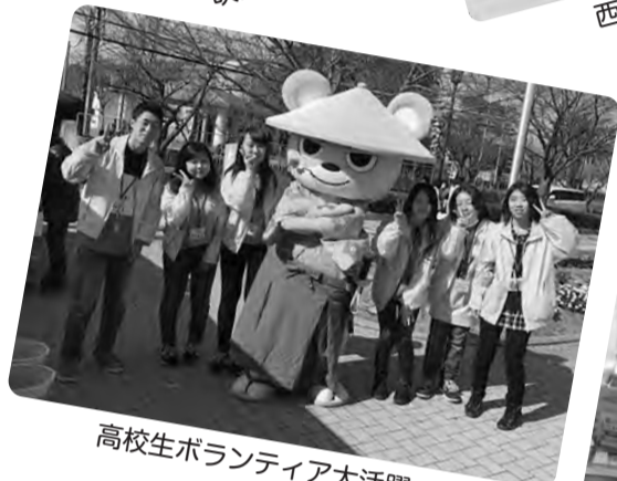
高校生ボランティア大活躍