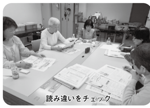
読み違いをチェック

音訳「あいうえお」は、平成27年泉南市社会福祉協議会主催の音訳講習会を受講したメンバーで立ち上げた音訳ボランティアグループです。 以前は個人ボランティアで活動していた「社協せんなん」と「ボランティアセンターだより」の録音を、昨年4月から引き継ぎ、視覚障がいの方に届けています。