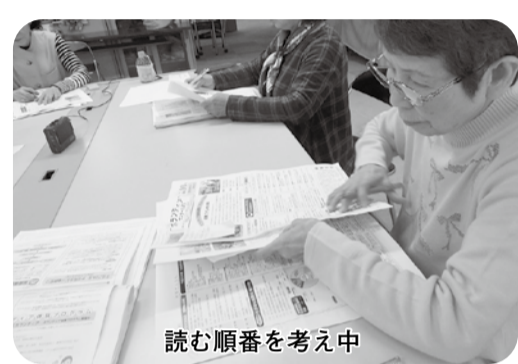
読む順番を考え中

現在メンバーは5名で、一人一面を担当し、年5回発行される前月に録音します。録音をする前にメンバー全員で、この記事はどう読めば伝わりやすいかなどを話し合い、工夫しながら読んでいます。 音訳講習会の受講経験がない方でも参加できますので、興味のある方は見学にお越しください。