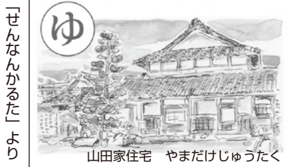
「せんなんかるた」より

編集・発行 泉南市ボランティアセンター 泉南市ボランティア連絡協議会 泉南市樽井一丁目8番47号 TEL 072(483)0294 FAX 072(483)0353 泉南市総合福祉センター(あいびあ泉南)3階 sennan-shi-vc@sennan-shakyo.or.jp