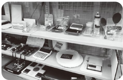
便利グッズの中にはオセロゲームも

たくさんボランティアに支えられ、点字や音声の図書が制作されていることを知りました。しかし、ここでもボランティアの高齢化が危惧されています。こういう施設は、先進国では国が主体となって運営されているが、日本では民間に頼っているのが現状とのことでした。センターでは、点訳ボランティア・音訳ボランティア・対面リーディングボランティア・電子書籍制作ボランティアなど登録して活動されている人がたくさんいるそうです。関心のある方は問い合わせしてみてください。