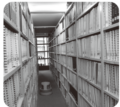
天井までの棚に 所蔵物がズラリ!

たくさんボランティアに支えられ、点字や音声の図書が制作されていることを知りました。しかし、ここでもボランティアの高齢化が危惧されています。こういう施設は、先進国では国が主体となって運営されているが、日本では民間に頼っているのが現状とのことでした。センターでは、点訳ボランティア・音訳ボランティア・対面リーディングボランティア・電子書籍制作ボランティアなど登録して活動されている人がたくさんいるそうです。関心のある方は問い合わせしてみてください。