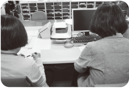
2人1組で点字の校正

☆生活便利グッズの 展示・販売 目の見えない方・見えにくい方向けの便利グッズがいっぱい。音声で時間を知らせる時計やワンプッシュで決まった量が出る調味料入れなど、さまざまな物がありました。