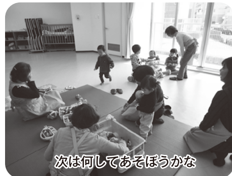
次は何してあそぼうかな

「ダンボの会」は、今年で17年目を迎えます。 泉南市子ども支援センターに在園している子どもの保護者が安心して研修を受けられるように、在園児の妹弟を預かっています。 子どもの笑顔とエネルギーをもらって、楽しいひとときを過ごしています。笑顔でお母さんにバイバイする子、眠る子、絵本やおもちゃで遊ぶ子…、そんな子どもたちと接するひとときは心も癒されます。 子どもが好きな方、私たちと子育て応援してみませんか！ 活動日に、見学は随時行っております。資格がなくてもできるボランティアです。どなたでも歓迎いたしますので、ぜひお越しください。