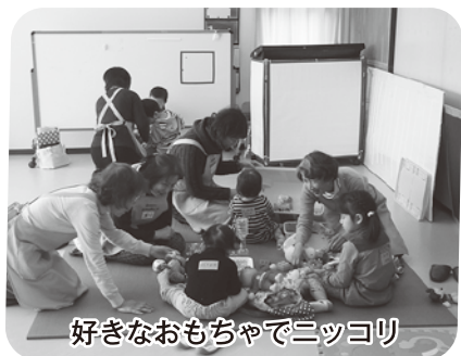
好きなおもちゃでニッコリ