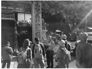
紀三井寺にハイキング