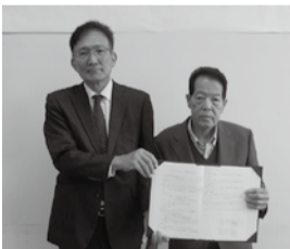
いずみ市民生協勝山理事長と泉南市社協松野会長