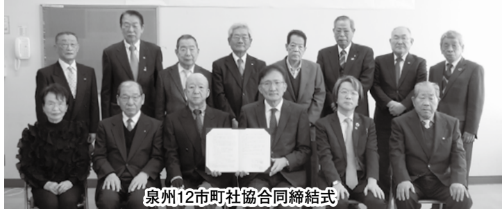
泉州12市町社協合同締結式